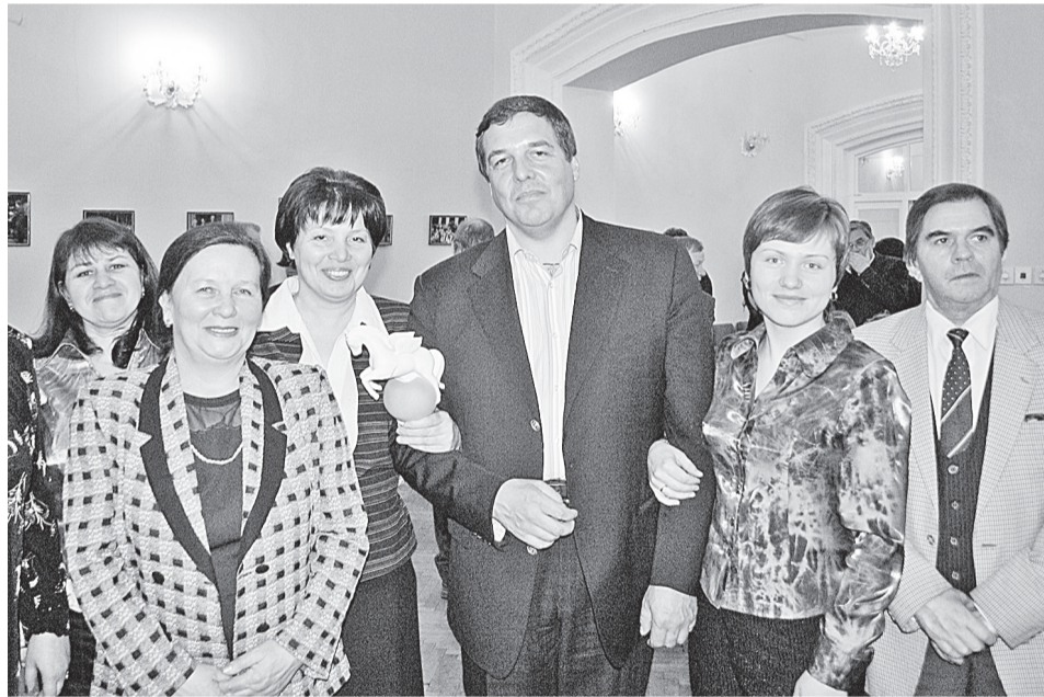
Коллектив «КИ» со звездой телеэкрана Александром Любимовым

— В 2005 году на церемонию награждения по итогам новгородского областного конкурса журналистов в здании филармонии съехались пишущие, вещающие и показывающие коллеги чуть ли не целыми коллективами. И, конечно, в числе собравшихся — наши дорогие читатели, радиослушатели и телезрители. На празднике присутствовали, в то время, губернатор области Михаил Прусак, депутаты областной Думы, главы городов и районов, руководители крупных предприятий Новгорода и районных городов. Аплодисментами встретил зал почётного гостя, президента общероссийской об-